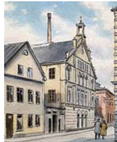
Akvarell "Gamla Immanuelskyrkan" R Eriksson 1956

En kort reflektion från Ingvar. Vi är årsbarn, uppväxta på söder, fyra år på Klingsborgsskolan och kyrkan som ett viktigt nav i ungdomen och upp i livet.